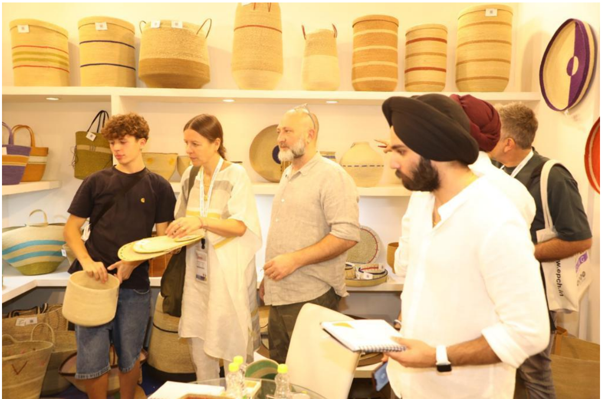
Photo 4&5: Overwhelming Response of Overseas Buyers during Opening Day of 56th Edition of IHGF-DELHI FAIR – Autumn'23 and Delhi Fair Furniture 2023 in India Expo Mart, Greater Noida