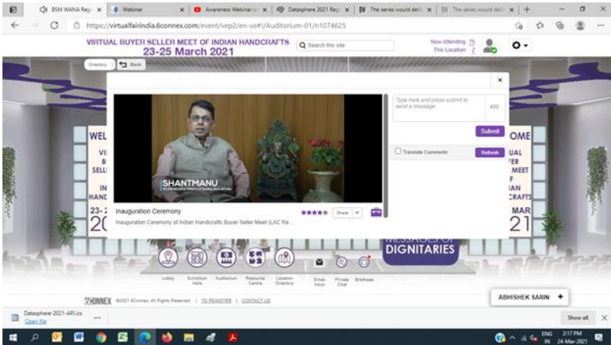
PHOTO 2 – SHRI SHANTMANU, IAS, DEVELOPMENT COMMISSIONER (HANDICRAFTS), ADDRESSING DURING INAUGURATION OF BUYER SELLER MEET IN LAC REGION ON 23.03.21