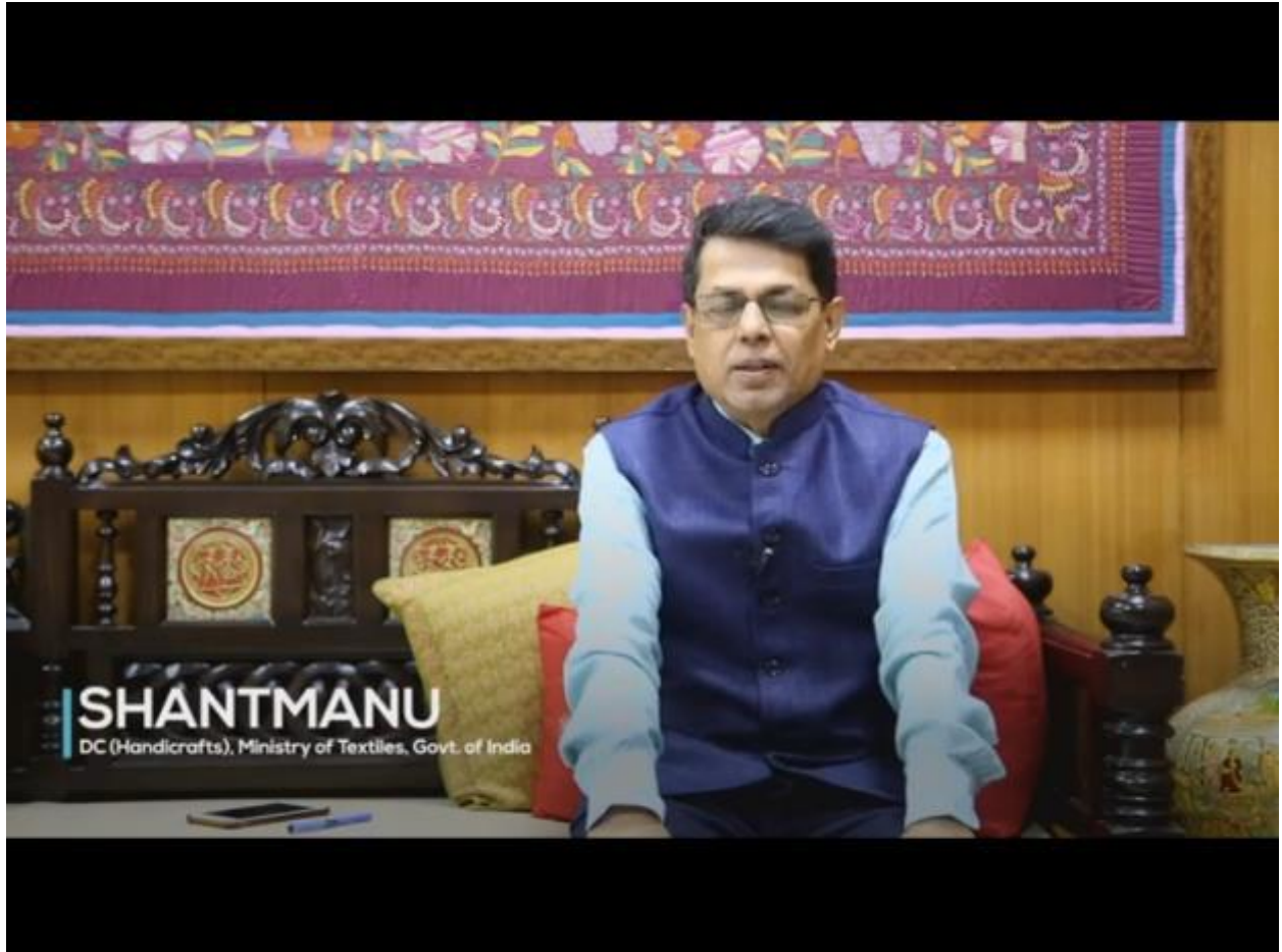
SHRI SHANTMANU, DEVELOPMENT COMMISSIONER (HANDICRAFTS), MINISTRY OF TEXTILES, GOVT. OF INDIA SPEAKING ON THE OCCASION OF IHGF DELHI FAIR AUTUMN'2020 ON VIRTUAL PLATFORM