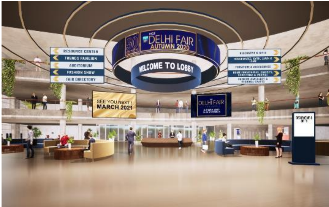
IMAGE OF MAIN LOBBY OF IHGF DELHI FAIR AUTUMN'2020 ON VIRTUAL PLATFORM