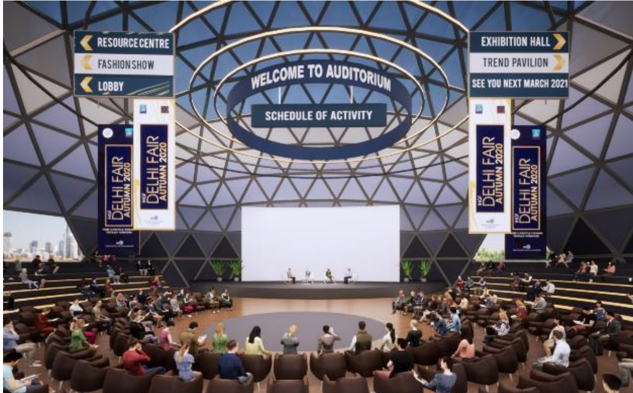
IMAGE OF AUDITORIUM OF IHGF DELHI FAIR AUTUMN'2020 ON VIRTUAL PLATFORM